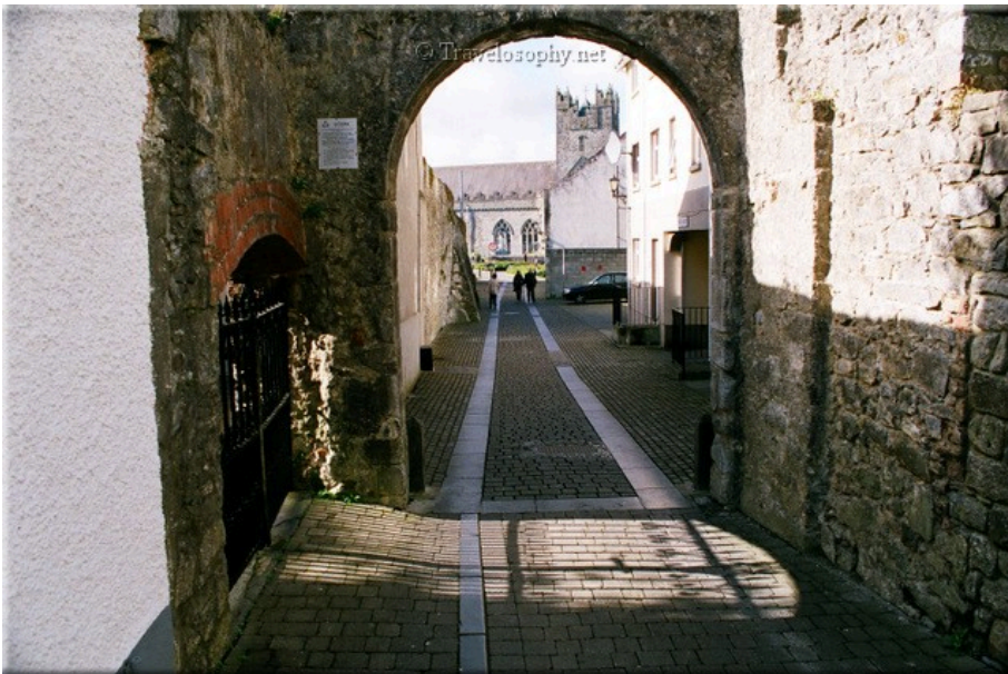
Towards The Black Abbey