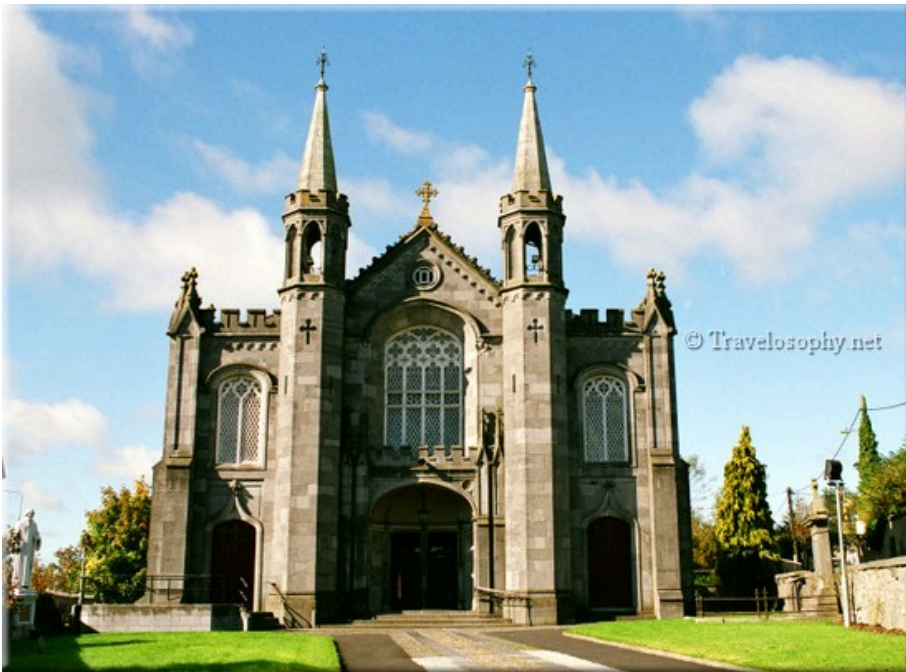
Saint Canice's Church – Dean St