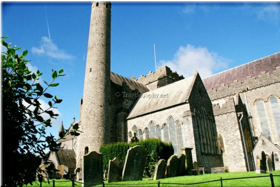
St Canice's Cathedral

A visit to Kilkenny City, County Kilkenny, Ireland, 22 Sept 2012, by Jean-Jacques M. —