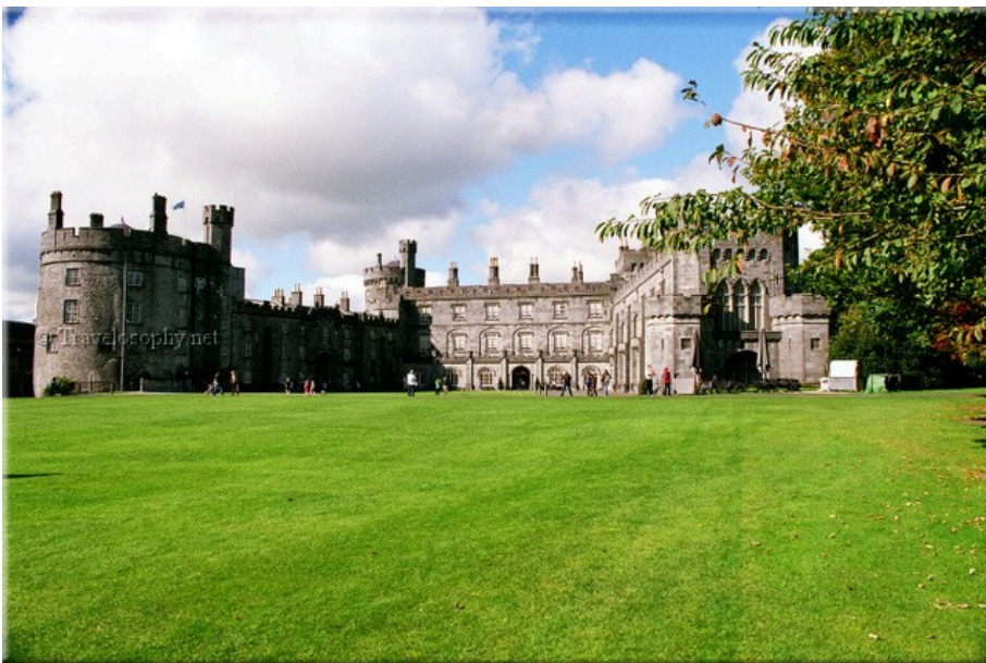
Kilkenny Castle Gardens