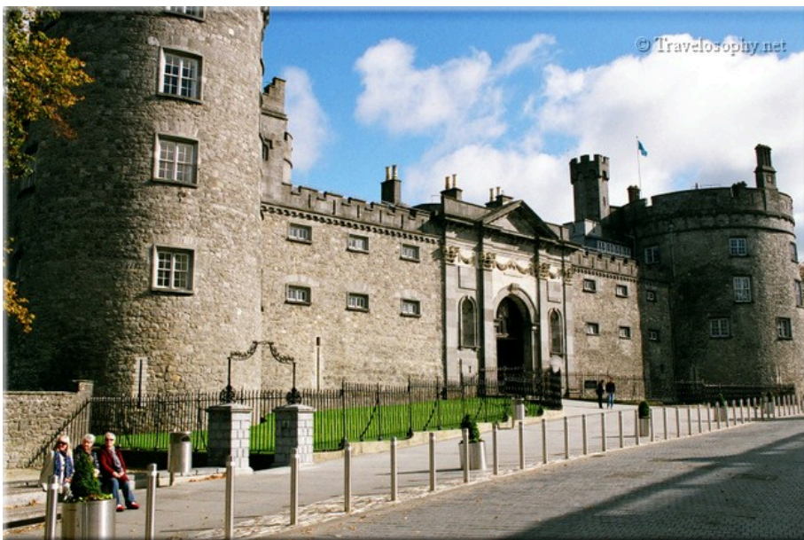
Kilkenny Castle – Entrance