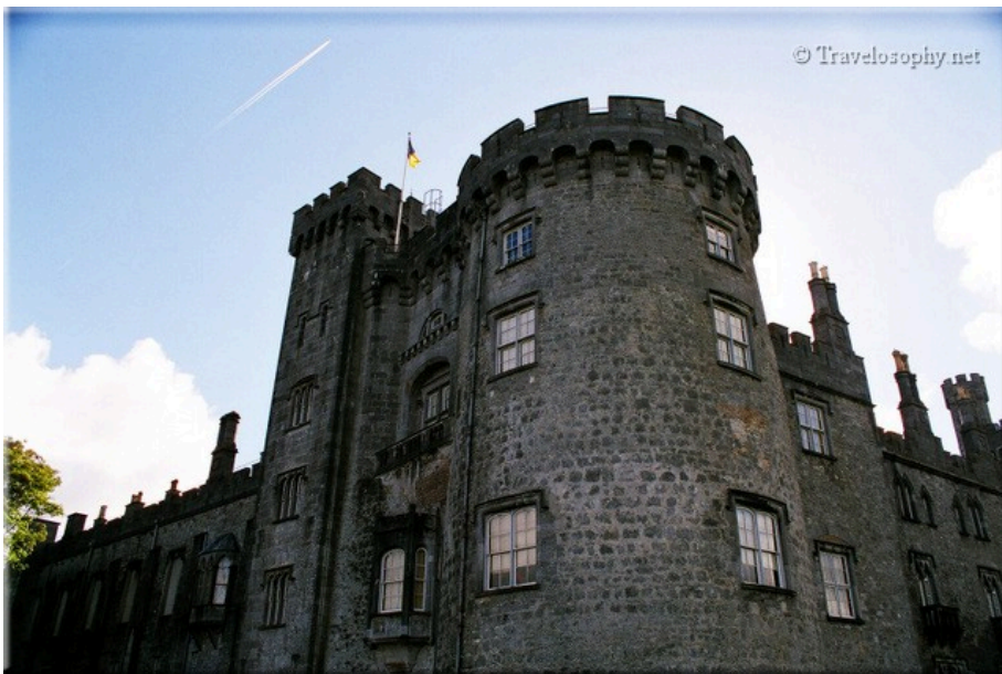
Kilkenny Castle – Riverside