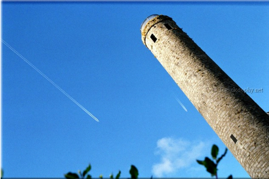
Saint Canice's Cathedral Tower