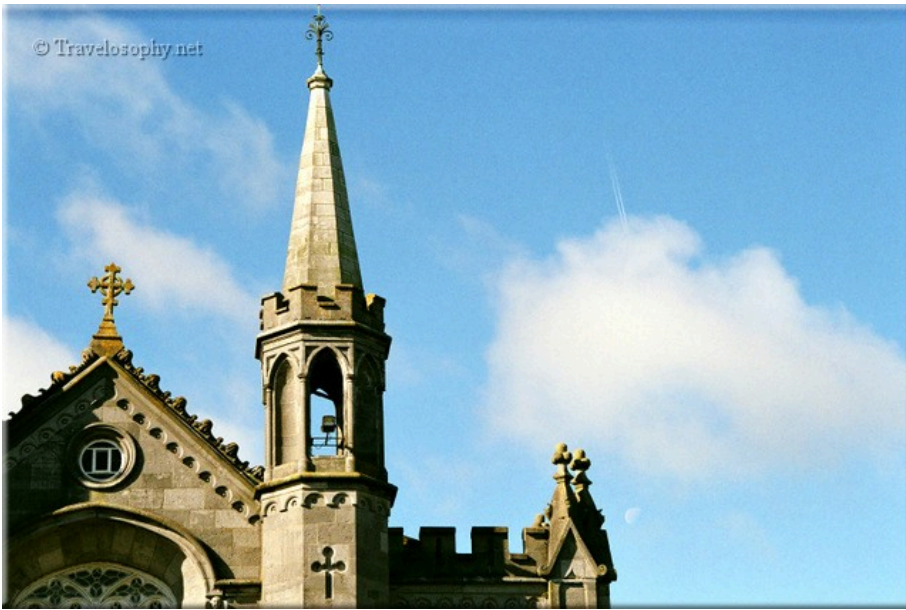
Church, Clouds & Moon